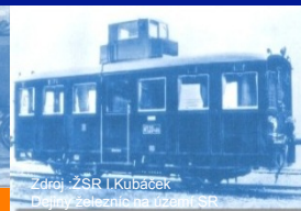
Zdroj: ŽSR I. Kubáček Dejiny železníc na území SR