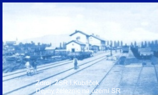
Zdroj: ŽSR I. Kubáček Dejiny železníc na území SR