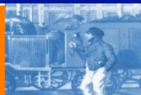
Zdroj: ŽSR I. Kubáček Dejiny železníc na území SR