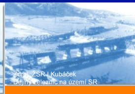
Zdroj: ŽSR I. Kubáček Dejiny železníc na území SR